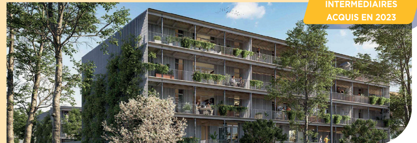
Résidence de 30 logements acquise dans le cadre de l'AMI 30 000 - Quartier du Sansonnet à Metz.

182 LOGEMENTS INTERMÉDIAIRES ACQUIS EN 2023