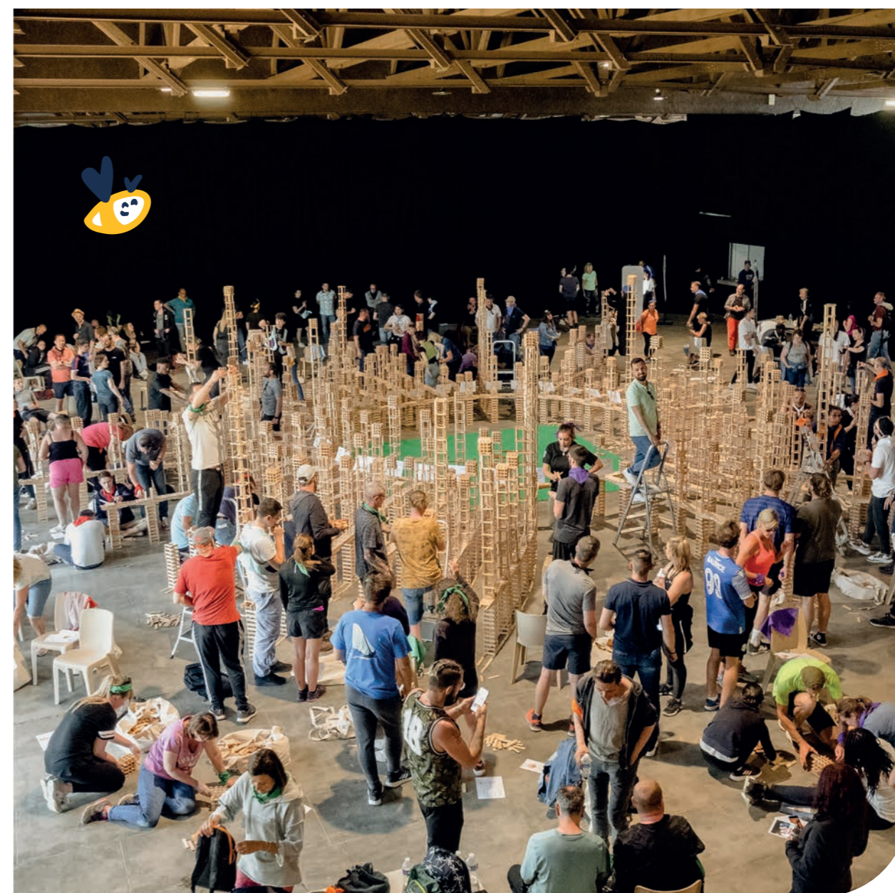
Premier événement teambuilding organisé pour les 350 collaborateurs Vivest au Fort Pélissier (54)