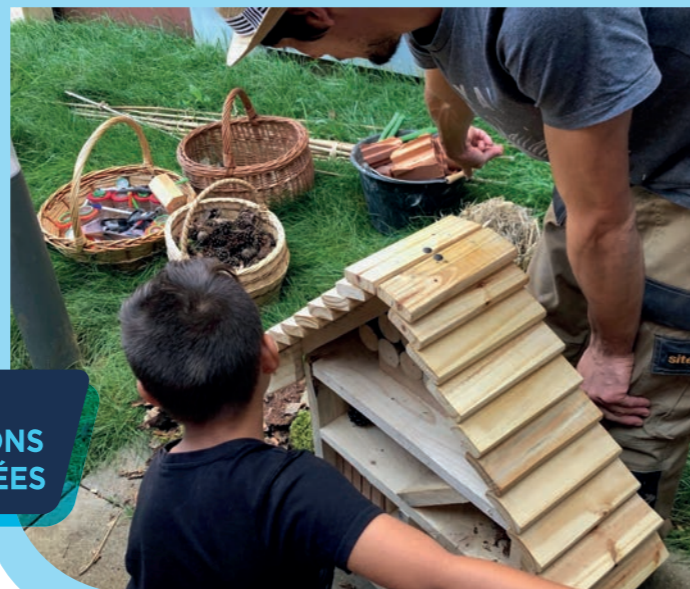
Après-midi biodiversité avec l'association Des Racines et des Liens

Environ 40 collaborateurs pour organiser cet événement et une centaine de participants incluant locataires et salariés